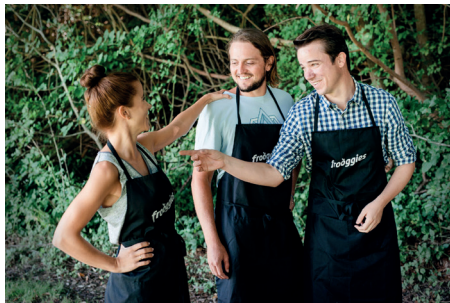
Die Gründer von Frooggies

Haben Sie vorgängig Fragen an die Referierenden, welche Sie an der Podiumsdiskussion beantwortet haben wollen? Stellen Sie diese auf forum@zbw.ch .